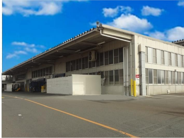
24年春の稼働を計画しているスズキグループの静岡県内の工場（候補）